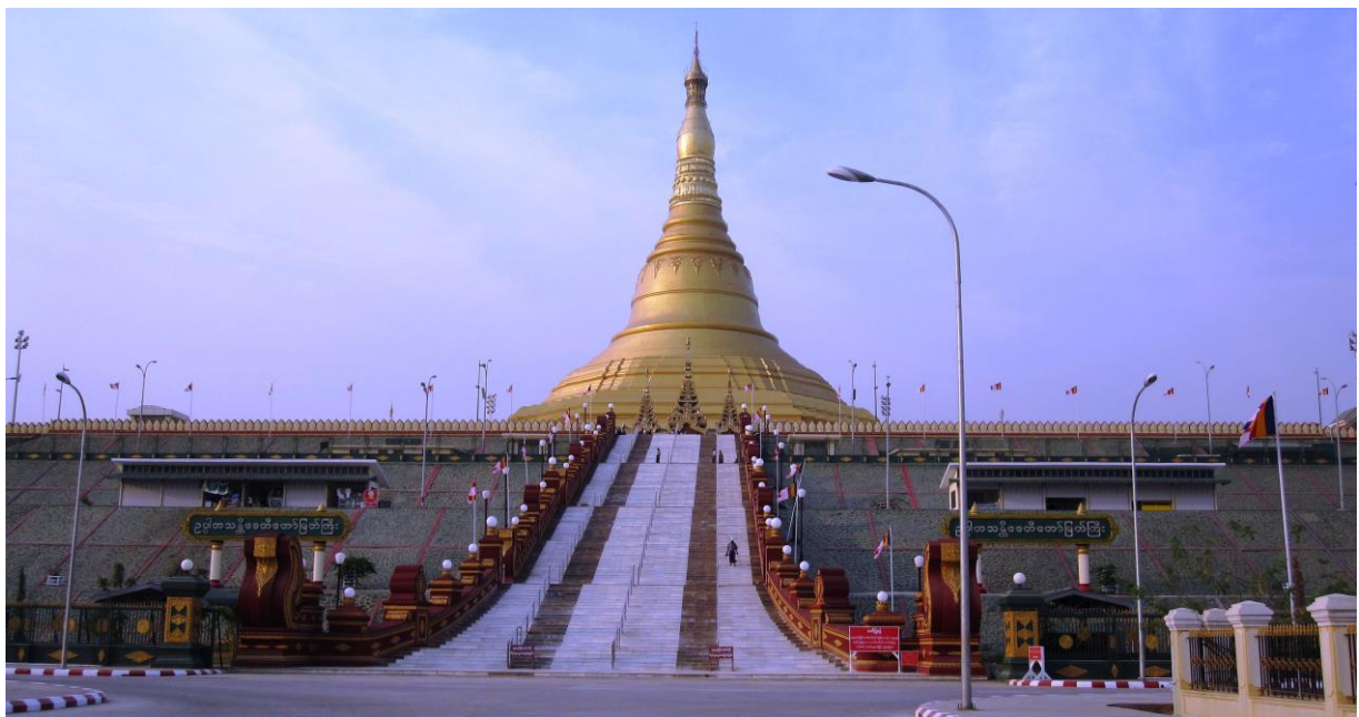
พระมหาเจดีย์สถานอุปปาตสันติ

พระมหาเจดีย์สถานอุปปาตสันติ หรือ พระเจดีย์สันติภาพ เป็นจุดสำคัญของเมืองเนปโตว์ พระมหาเจดีย์มีความสูง ๓๒๕ ฟุต และเป็นพระมหาเจดีย์จำลองของพระมหาเจดีย์เวดากองที่ย่างกุ้ง องค์พระมหาเจดีย์สร้างอยู่บนพื้นที่ ๑๖ เอเคอร์ สร้างโดยรัฐบาลสาธารณรัฐประชาชนจีน โดยสร้างเสร็จสมบูรณ์ในวันที่ ๑๕ มีนาคม ๒๕๕๑ และทำการพุทธาภิเษกในวันที่ ๙ มีนาคม ๒๕๕๒ ภายในพระมหาเจดีย์ได้ประดิษฐานพระพุทธรูปหยกปางต่าง ๆ ไว้มากมาย ในบริเวณพระมหาเจดีย์อุปปาตสันตินี้ยังมี พระอุโบสถ (Withongara Ordination Hall) ที่พักผู้ดูแลพระมหาเจดีย์ (Cetiypala Chamber) ที่พักสงฆ์ (Sangha Yama Hostels) พระวิหารศาสนมหาพิมาน (Sasana Maha Beikmandaw Building) พิพิธภัณฑ หอพระไตรปิฎกและหอจดหมายเหตุ